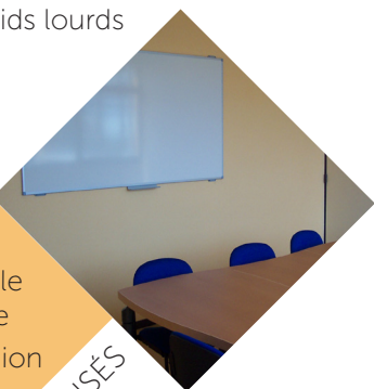
Salle de réunion